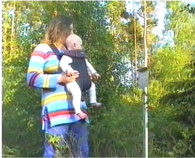
På väg till Gloffagrottorna