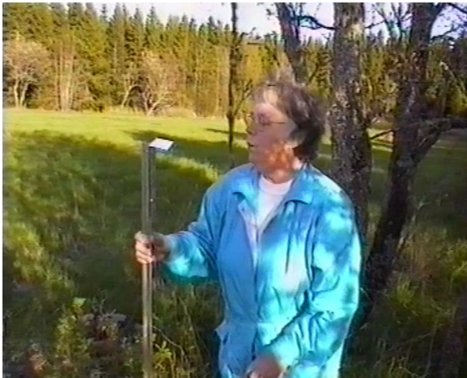
Spiselhällen till torpet