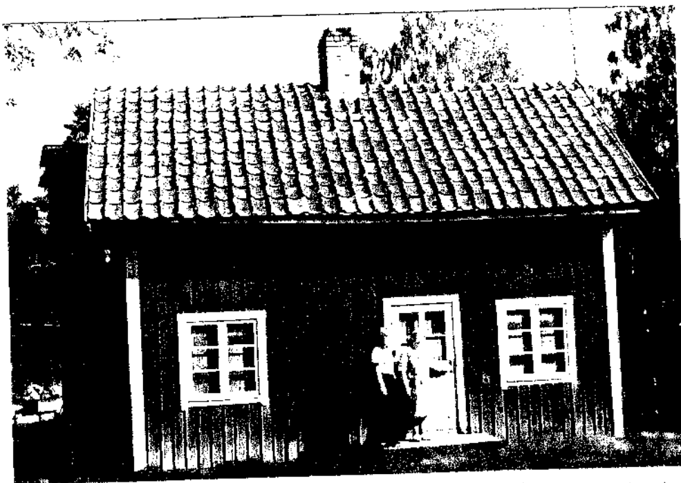
HÄLLEMON FLYTTAD TILL OMBERG