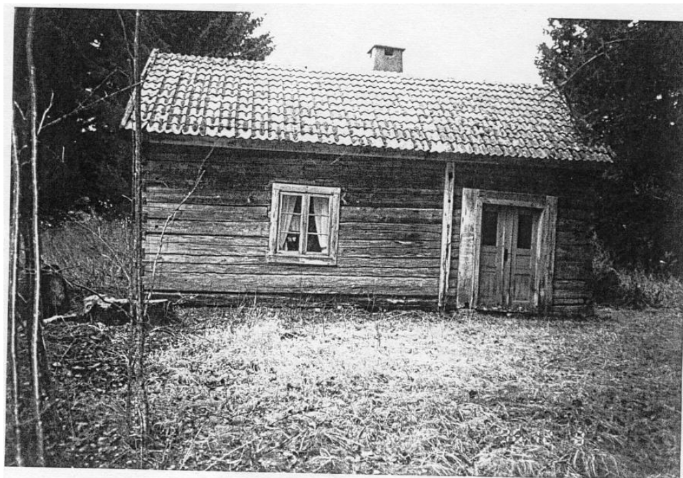
Mellangården i Ramberstorp 1998 /HS