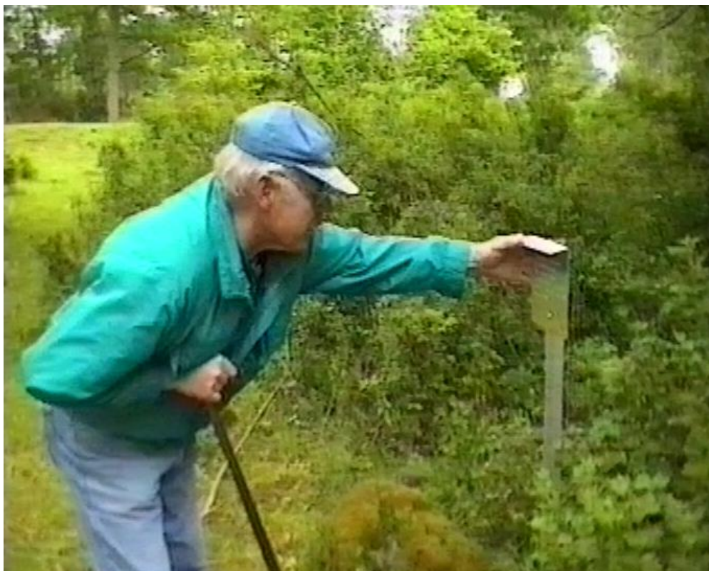
Stenparti på Skinnarbo