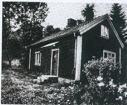
Grenadjärortorpet Sand 1988. Friköptes och blev eget småbruk 1909. Torpet kunde föda två kor och gris, på åkerlapparna odlades säd och potatis