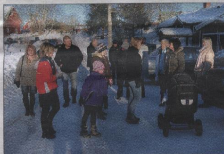
Unga och gamla är på väg in i snickeriet.