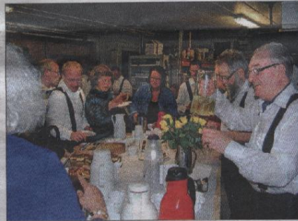
Runt kaffeborden är det trängsel och trivsel.