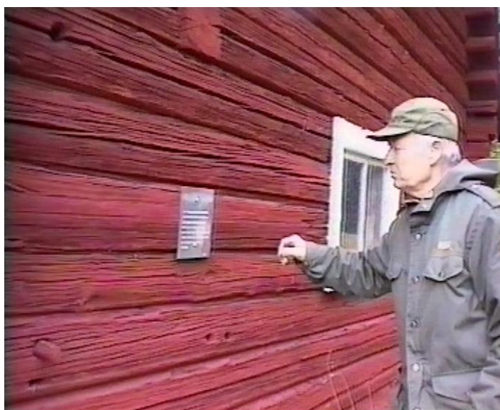
Skylden placerad på Grenadjäratorpets uthus