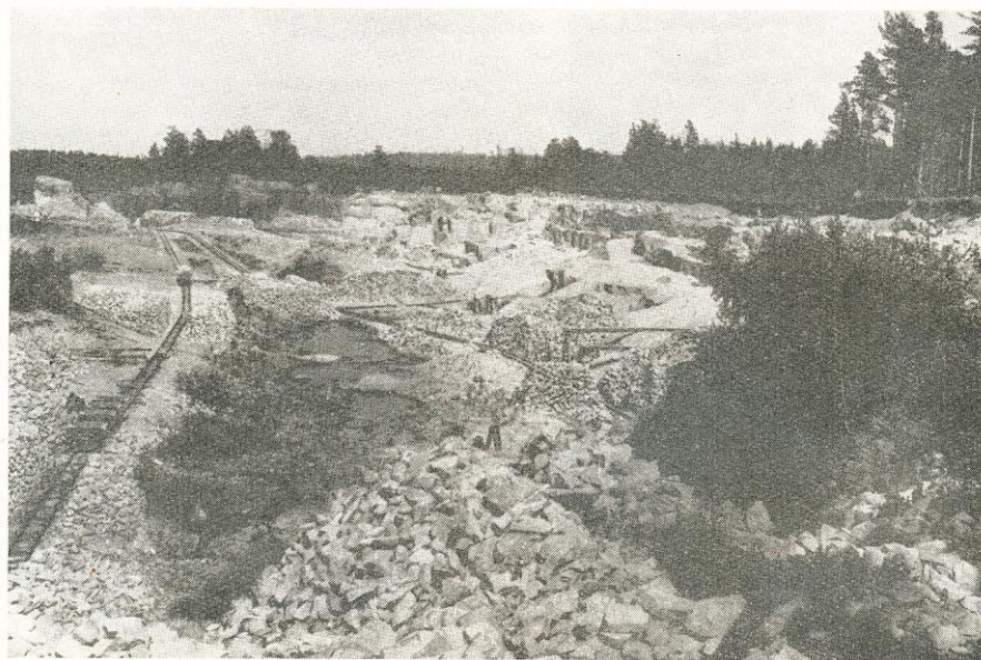
Del av Lemunda sandstensbrott, Motala landskommun.